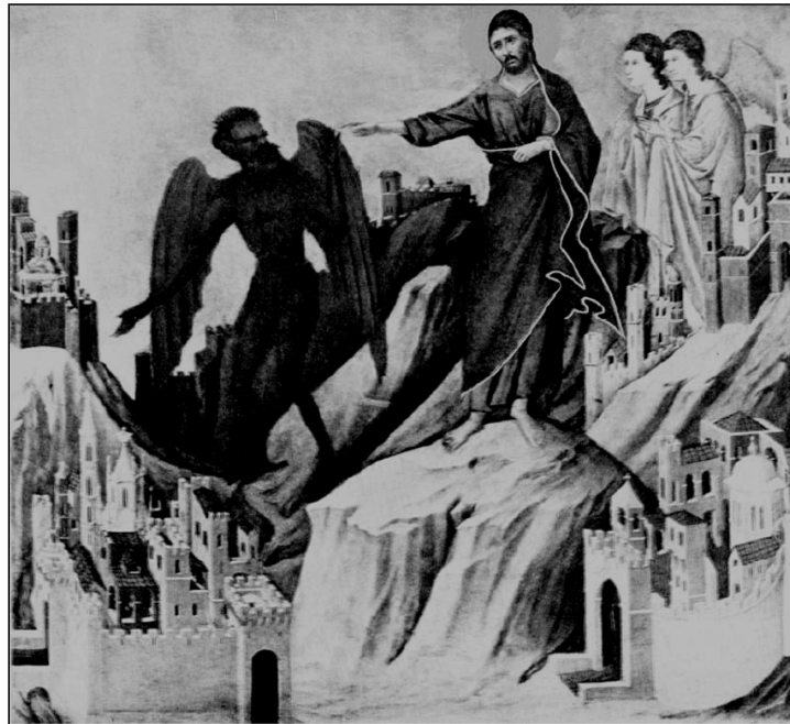
Duccio di Buoninsegna, 1282-1339 The temptation of Jesus Tempera on wood, 43.2 x 46 cm, The Frick Collection, New York.

De werkelijkheid van de aanwezigheid van de duivel in de rookkolom zit niet aan de kant van de foto, maar in het brein van de kijker. Wanneer we waarnemen doen we dat niet alleen met onze ogen, maar ook, en vooral, met onze hersenen. 5 Ons brein is constant bezig de visuele indrukken die we opdoen te vergelijken met eer-