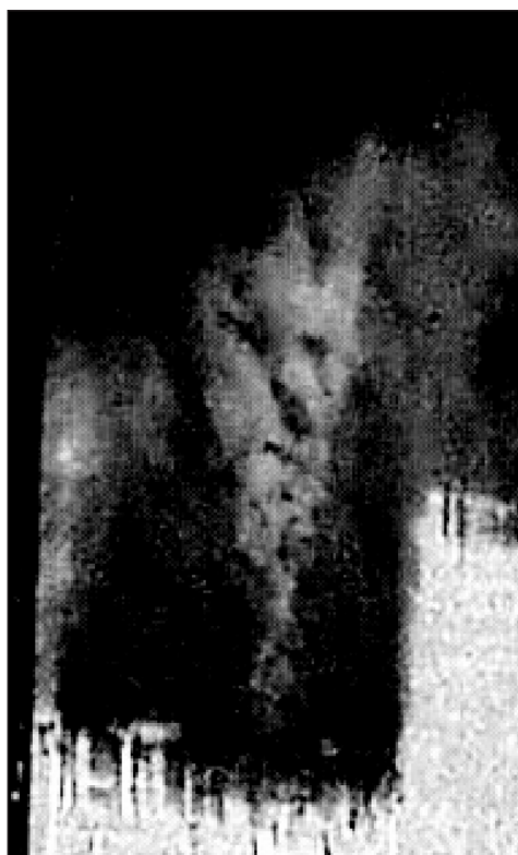
Devil in the smoke.. 1

Het digitale tijdperk waarin wij leven levert nog een ander aspect op dat het idee dat een foto de werkelijkheid afbeeldt ondermijnt. Photoshopping is een bekend verschijnsel geworden. Beelden, en met name digitale beelden kunnen makkelijk gemanipuleerd worden. Fotografie is door de komst van de digitale camera een kunstvorm geworden die steeds meer overeenkomsten met schilderkunst vertoont. De artiest – de fotograaf met zijn of haar camera en computer – speelt het spel van de verbeelding op een vergelijkbare wijze als een schilder dat doet. Maar ondanks de algemeen verbreide kennis van en toegang tot digitale beeldbewerking, blijft het idee van een foto als werkelijkheidsopname toch hard-